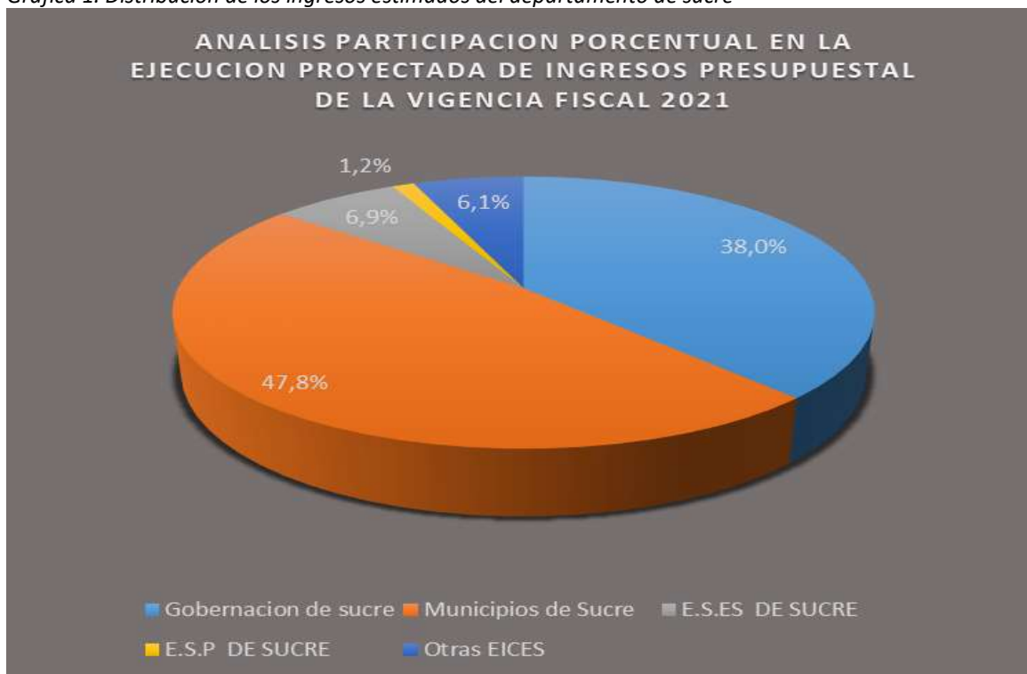
Gráfica 1. Distribución de los ingresos estimados del departamento de sucre

De este valor proyectado fueron recaudados efectivamente por estos entes 2,19 billones de pesos, correspondiendo al 89% del presupuesto total proyectado: la primera entidad que es la administración central departamental participa con el 30.4% o sea $886.063,5 millones, los entes territoriales municipales en el 47,8% o $1.047 billones, las ESE'S con el 5,7% que en términos absolutos corresponden a $125.592,6 millones, las ESP'S con el 1% y $22.265,0 millones y las otras entidades con el restante 5% o sea $110.512,1 millones.