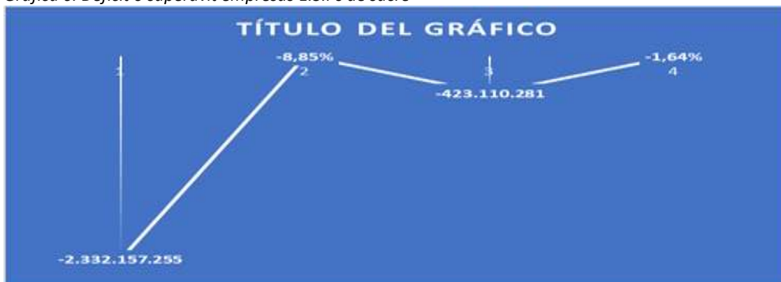
Gráfica 6. Déficit o superávit empresas E.S.Ps de sucre

En la vigencia anterior 2020, el resultado consolidado de la gestión presupuestal, mostró que los gastos superaron los ingresos, generando así, un déficit fiscal de $-2.332.1 millones, representado por 8.85%, del total de recaudo, y estas empresas han seguido generando ya que en la vigencia 2021 se generó otro déficit por un valor de $-423.1 millones. En el cuadro siguiente, se relaciona el consolidado de ingresos, gastos y el déficit fiscal generado por las E.S.P, entre las vigencias 2020 y 2021.