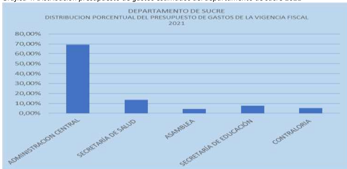
Gráfica 4. Distribución presupuesto de gastos estimados del departamento de sucre 2021

Del total asignado, el gobierno departamental realizó compromisos presupuestales por valor de $886.063.5 millones, que equivale a un nivel promedio de eficiencia del 95,10% de la asignación presupuestal. En Gastos de Funcionamiento se comprometieron $65.511.3 millones con un porcentaje del 98,67% de su cálculo. En las Secretarías de Educación fueron ejecutados $5.048.9 millones que equivalen al 99,97% y Salud fueron ejecutados $8.821.4 millones que equivalen al 93,47%. Los compromisos de la Asamblea Departamental fueron de $ 2.833.1 millones cuyo nivel de eficiencia fue de 98,13%, y la Contraloría correspondieron al 99,92%% del cálculo o $3.485.3 millones, siendo estas entidades las que utilizaron casi la totalidad del presupuesto asignado.