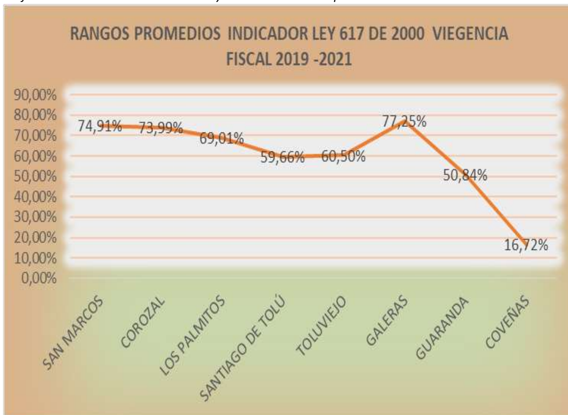
Gráfica 5. Distribución indicadores de ley 617 de 2000 municipios de sucre 2021

Se observa el estado del indicador de los Municipios del Departamento de Sucre en la vigencia 2019. El Municipio de Coveñas presenta unas finanzas solventes, es decir, el indicador es menor del 40% con respecto al límite máximo establecido por la ley. El Municipio de San Marcos que no ha podido salir de su estado crítico.